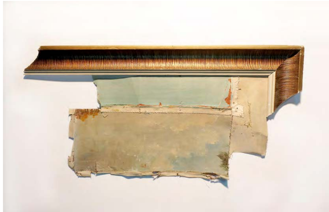
Composición utilizando diferentes cielos de paisajes populares