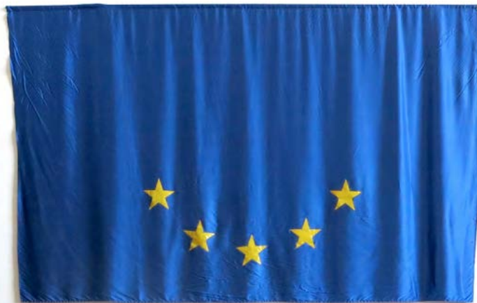
“Bandera de Europa del Sur”

Una reflexión sobre la situación económica actual en la Zona Euro realizada desde la perspectiva de los países afectados por las medidas de rescate del Banco Central Europeo.