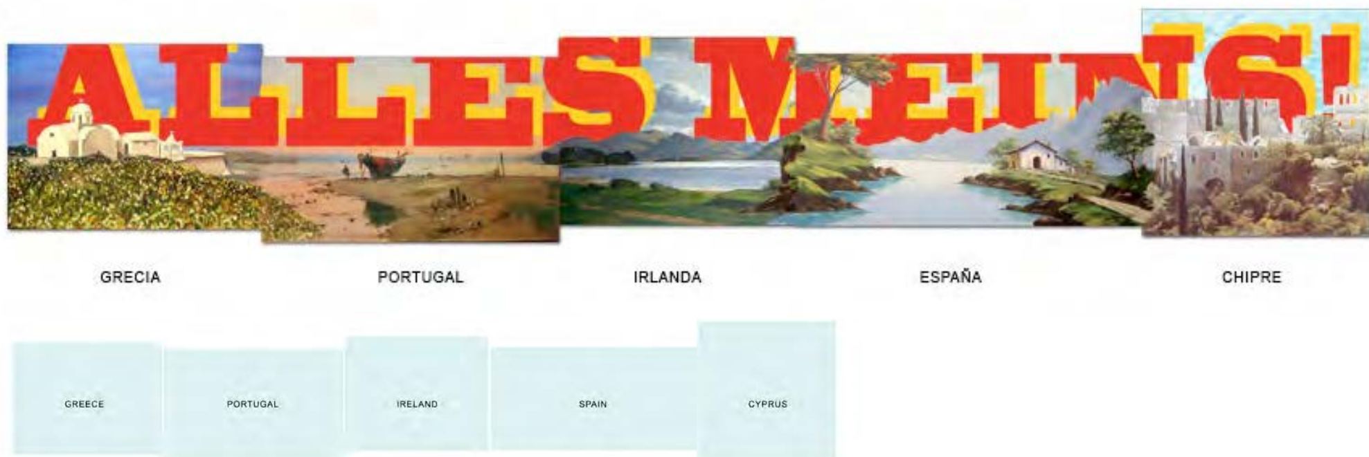
Boceto - recreación de ALLES MEINS! (En proceso)

Un lugar irreal en el que apenas existe ningún personaje, haciendo referencia al problema de emigración que conlleva un problema como este, territorios despojados de identidad, globalizados a la fuerza.